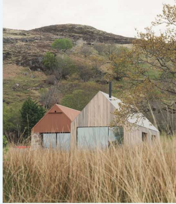
Dualchas: Tŷ yn Diabeg

PENSEIRI - ARWEINWYR YNTEU DDILYNWYR, GOLWG ARALL