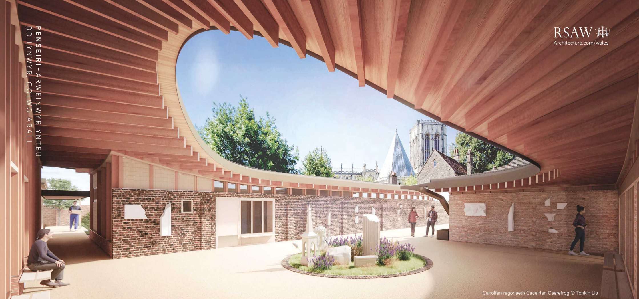
Canolfan ragoriaeth Cadeirlan Caerefrog © Tonkin Liu

Ar 30 Tachwedd 2023, byddwn yn dathlu 30ain Gynhadledd Flynyddol RSAW drwy ailymweld â themâu'r gynhadledd gyntaf erioed yn 1994: 'Penseiri - Arweinwyr ynteu Ddilynwy'r y deng mlynedd nesaf'